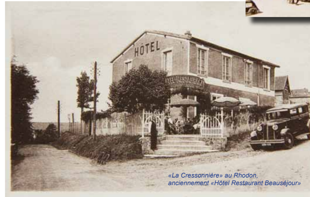
«La Cressonnière» au Rhodon, anciennement «Hôtel Restaurant Beauséjour»